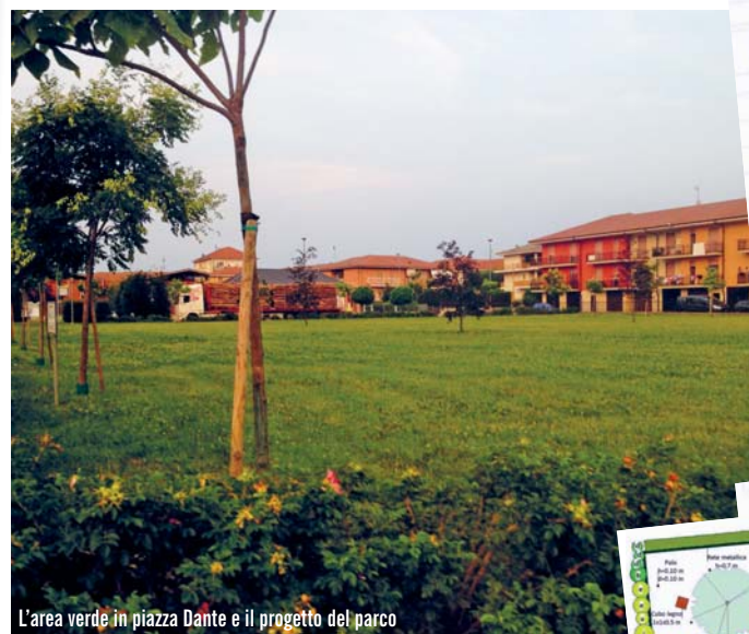
L'area verde in piazza Dante e il progetto del parco

In base ad una convenzione con il Comune, sarà in gran parte l'associazione Lions Club Busca e Valli a realizzare un parco in piazza Dante per un impegno complessivo di 100.000 euro, che parte con un primo lotto del valore di 45.000 euro. Previste la creazione di un anfiteatro, un percorso didattico e sensoriale rivolto a bambini e persone con disabilità, una fontana, arredi vari. Collabora l'associazione Busca&Verde.