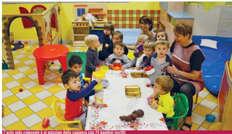
L'asilo nido comunale è al massimo della capienza con 25 bambini iscritti

Bambini, anziani, disabili: i servizi alla persona sono parte fondamentale del bilancio