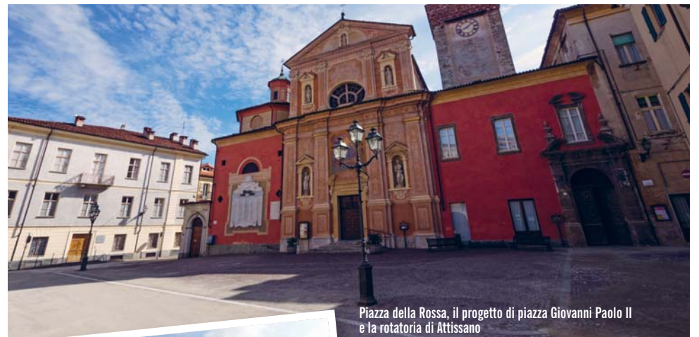
Piazza della Rossa, il progetto di piazza Giovanni Paolo II e la rotonda di Attissano