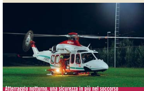
Atterraggio notturno, una sicurezza in più nel soccorso

Il campo da calcio dello stadio Natale Berardo sarà presto attrezzato all'atterraggio notturno dell'elisoccorso. Il Comune ha intenzione di investire le risorse necessarie per attrezzare il campo con le strutture richieste per ottenere l'autorizzazione in base al regolamento dell'Unione Europea per la sicurezza di volo notturno. L'importante intervento sarà possibile grazie alla collaborazione con il Dipartimento Regionale del 118 e con le associazioni sportive che usufruiscono dell'impianto.