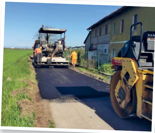
290.000 euro sono destinati alla bitumatura strade

Sono destinati in un anno alla sistemazione e la bitumatura delle strade comunali, con particolare riguardo alle esigenze delle strade frazionali.