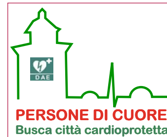
Il logo del progetto

Non si tratta soltanto di piazzare alcuni DAE (defibrillatore semiautomatico esterno) nella città, bensì di distribuirli in posizioni strategiche e, soprattutto, di istruire il maggior numero di persone possibile ad usarli correttamente, insegnando anche le nozioni di base determinanti in una situazione di emergenza sanitaria. "Persone di cuore fa leva sullo spirito di solidarietà dei buschesi e li chiama ad impegnarsi in prima persona per imparare come si fa a salvare una vita - spiega Giamello - Il posizionamento dei primi DAE sarà portato a termine entro breve tempo, mentre i corsi saranno riproposti via via, dopo i primi due che si svolgono in questi giorni e che hanno in breve raggiunto il numero massimo di iscrizioni, con un centinaio di partecipanti". Ogni singola postazione pubblica di un defibrillatore costa circa duemila euro ed è pagata grazie all'apporto di privati, associazioni ed aziende. Il Comune si impegna nella sistemazione e nella manutenzione delle postazioni, la Cri svolge i corsi di formazione a prezzi calmierati con gli istruttori volontari "p-bsl-d" certificati. Info: tel. 340.5506757; blsd@cribusca.it