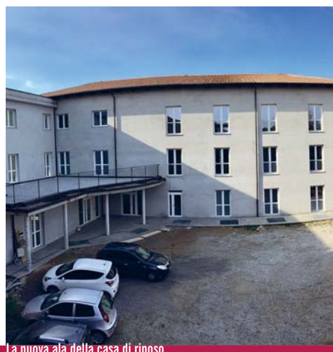
La nuova ala della casa di riposo

L'opera, è stata finanziata per i primi lotti dal Comune con un investimento di 700.000 euro ed è ora completata a spese dell'Ospedale Civile di Busca, che vi ha destinato 1.260.000 euro, senza contare la spesa per gli arredi. I lavori sono seguiti dall'ufficio tecnico comunale. La nuova ala ospiterà gli ambulatori Asl, un grande salone e tre camere a disposizione della casa di riposo, diversi locali di servizio e 6 mini-alloggi per anziani al secondo piano.